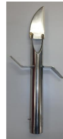
採血用套管(とうかん)ナイフ