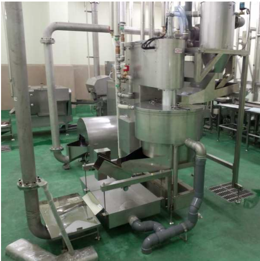
洗浄機全体(左奥は、大腸切開機)

大腸(胃袋)エアーシューター等で自動投入⇒自動洗浄機(洗浄中汚水分離切替付き)製品のみ排出します。