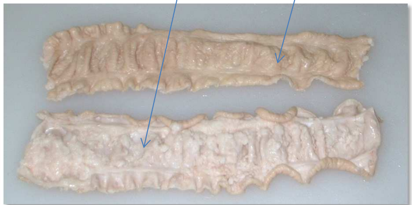
切開・洗浄・脂取り・ポイルした、美味しい大腸