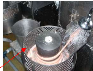
セットした紐（麻又はナイロン）で縛る 3. 巻取りドラム：小腸円周長さ約1m