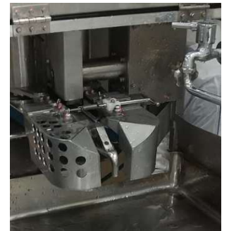
脂取り部：ベルト開閉式