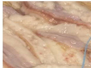
甘みの脂が乗った小腸 （脂取り洗浄後）